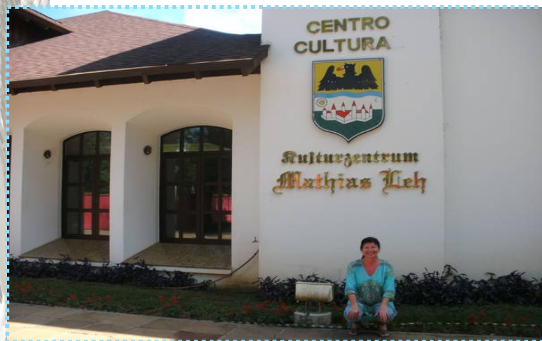
Imagem 89: Vista do Centro

O distrito de Entre Rios – PR é uma comunidade rural que foi colonizada por imigrantes vindos da Suábia na Alemanha. Hoje seus descendentes, ao lado do orgulho e da gratidão de ter no Brasil sua nova pátria, guardam o exemplo de seus antepassados e persistem para vencer os novos desafios trazidos pela globalização: a profunda e rápida modernização da agricultura em tempos de mercados sem fronteiras e a preservação de sua identidade cultural. Para isso conta com o Centro de Cultural Mathias Leh.