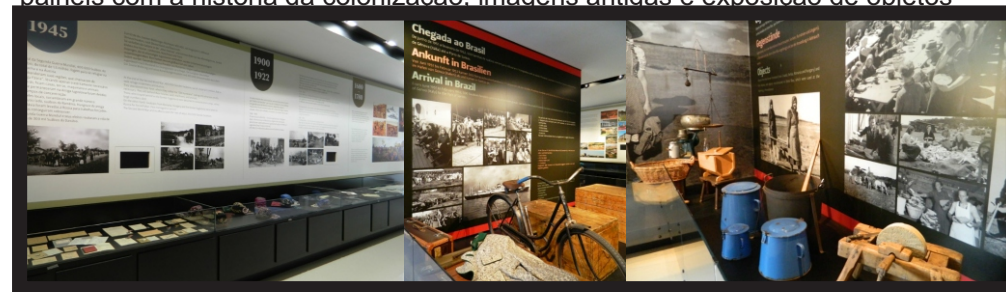
Quadro 06: Exposição histórica

painéis com a história da colonização, imagens antigas e exposição de objetos