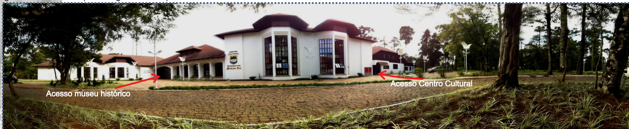
Imagem 93: Vista geral do Centro Cultural