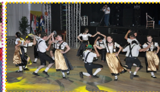
Imagem 95: Grupo de danças juvenil.