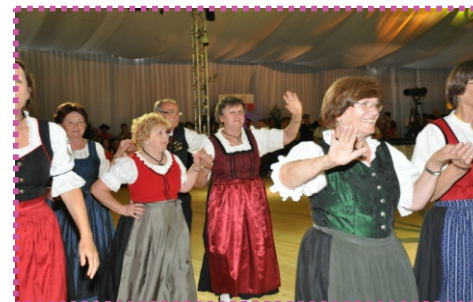
Imagem 94: Grupo de danças adulto.

O Centro tem em sua forma os traços da arquitetura alemã, marcante principalmente em seu telhado, com grande inclinação, e também grandes aberturas (ver imagem 92 e 93).