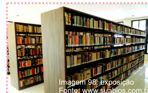
Imagem 98: exposição