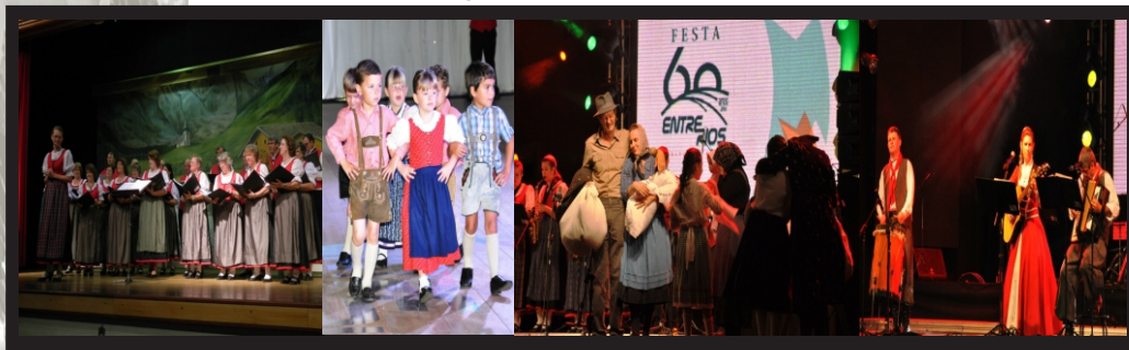
Quadro 05: Atividades do centro cultural

No museu contém um acervo que retrata, em centenas de fotos e objetos de época, o surgimento da Cooperativa de agricultores e a trajetória dos suábios do Danúbio: desde o século XVIII, na Alemanha, até sua imigração para o Brasil.