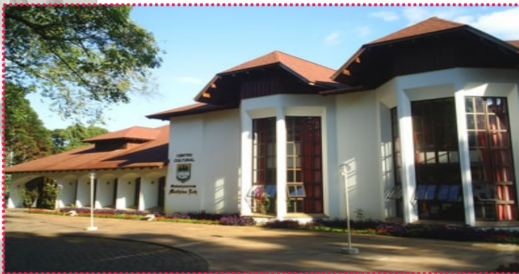
Imagem 92: Vista do Centro Cultural

O Centro tem em sua forma os traços da arquitetura alemã, marcante principalmente em seu telhado, com grande inclinação, e também grandes aberturas (ver imagem 92 e 93).