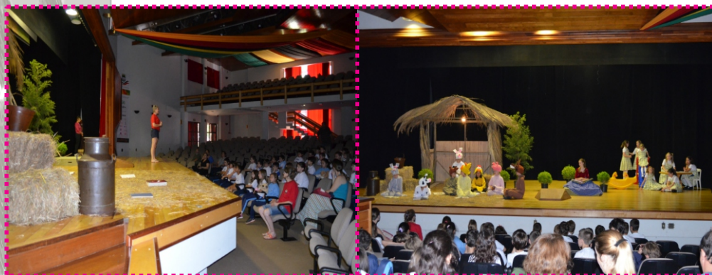
Imagem 96: Auditório para apresentações